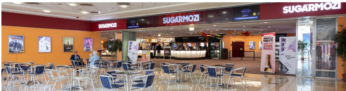
(Sugár Mozi 2019-ben)

A létesítményben nem csak filmezni lehet, hanem terembérlésre is lehetőség nyílik kisebb-nagyobb rendezvényekhez, melyhez a mozi kérés esetén biztosít ételt és italt is. Ezenfelül folyamatos akciókkal várják a betérni vágyókat.