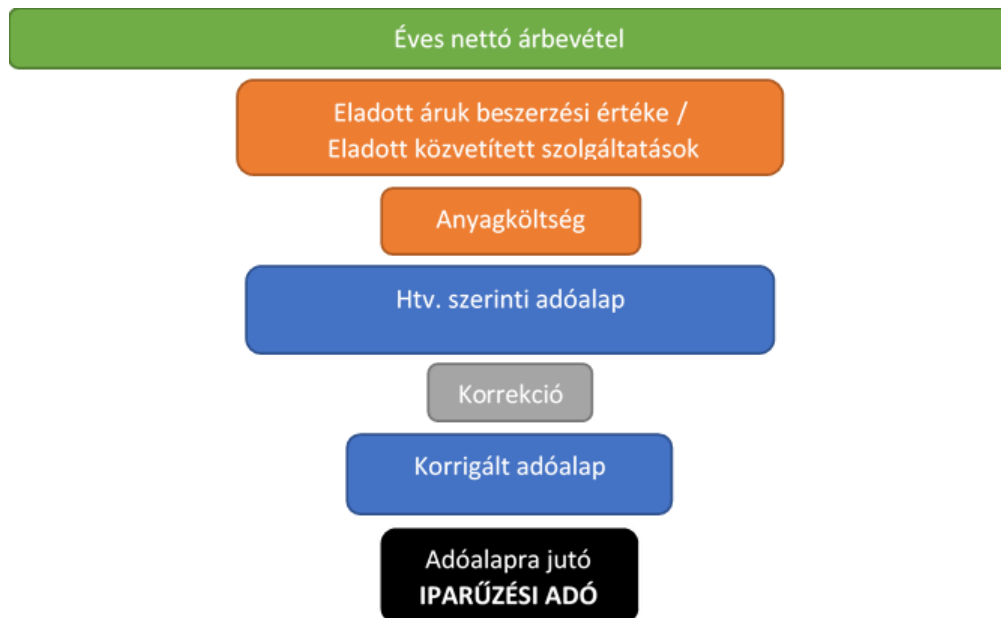
6. ábra. Adóalap kiszámítás folyamata

A helyi iparüzési adó számításának folyamatát szemléltetem a 6. ábrával.