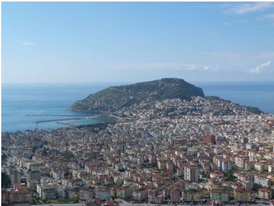
8. kép: Alanya ma