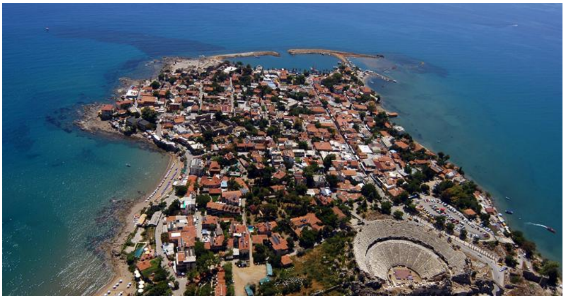
10. kép: Side ma