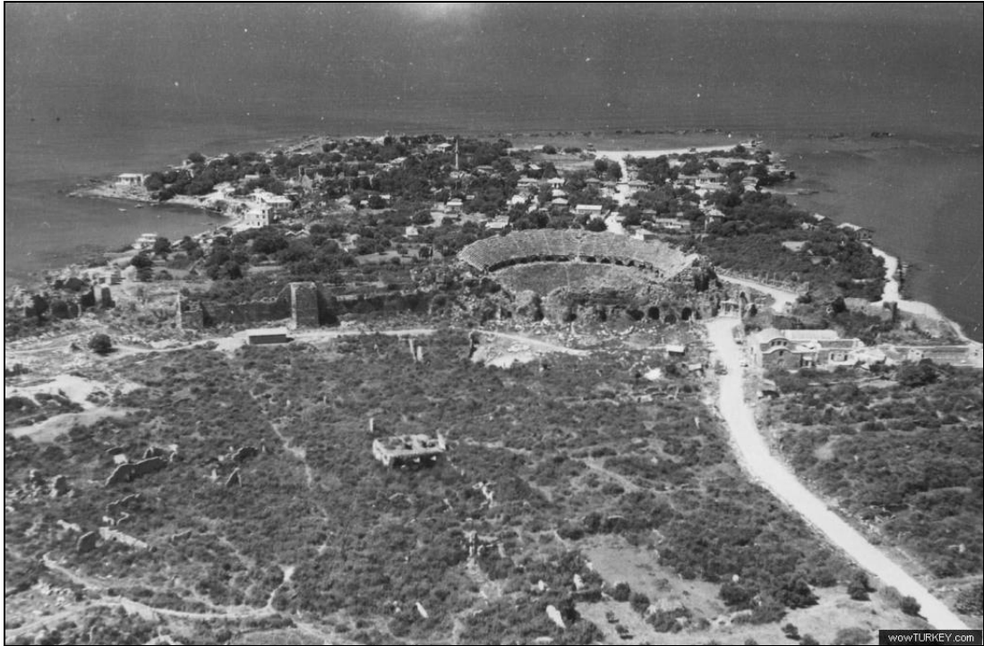
9. kép: Side az 1950-es években