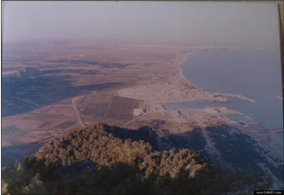
5. kép: Antalya az 1960-as években