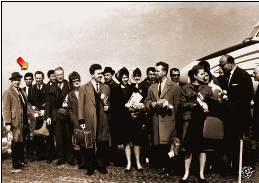
2. kép: Az első turistacsoport érkezése, 1967