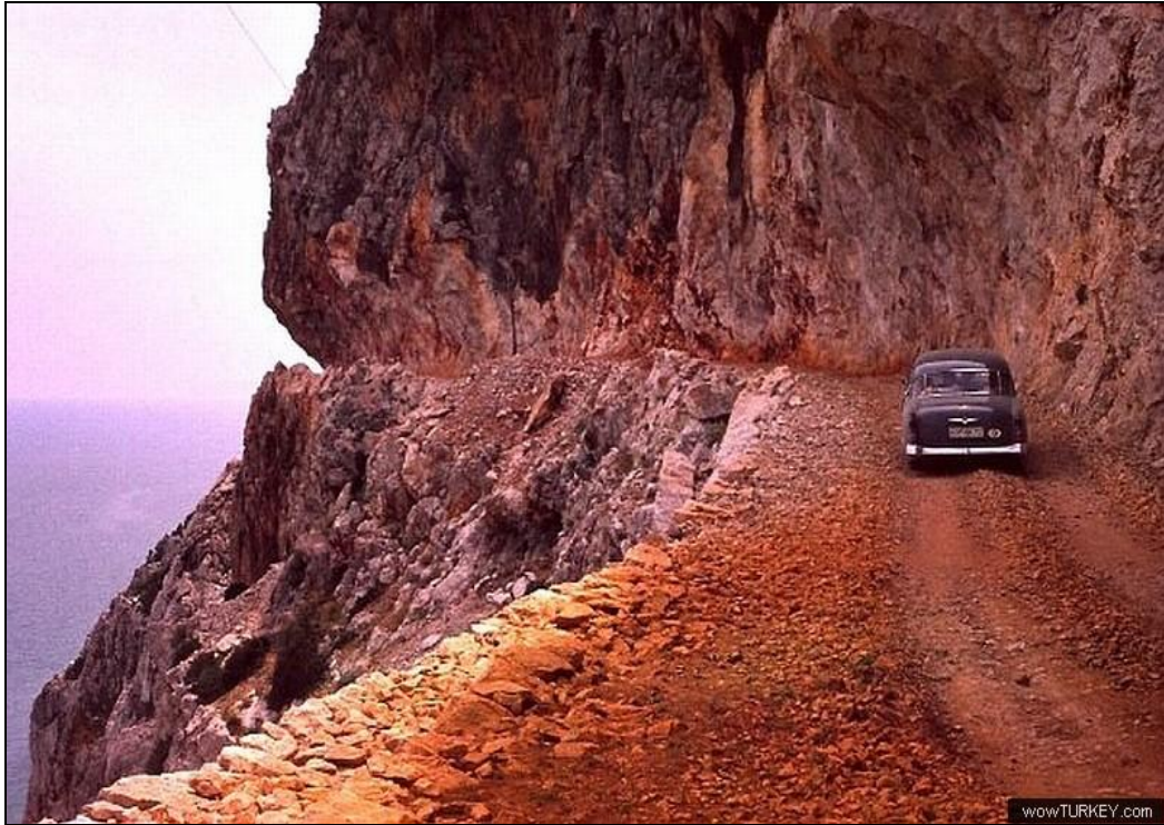
3. kép: A Kemerbe vezető út, 1960