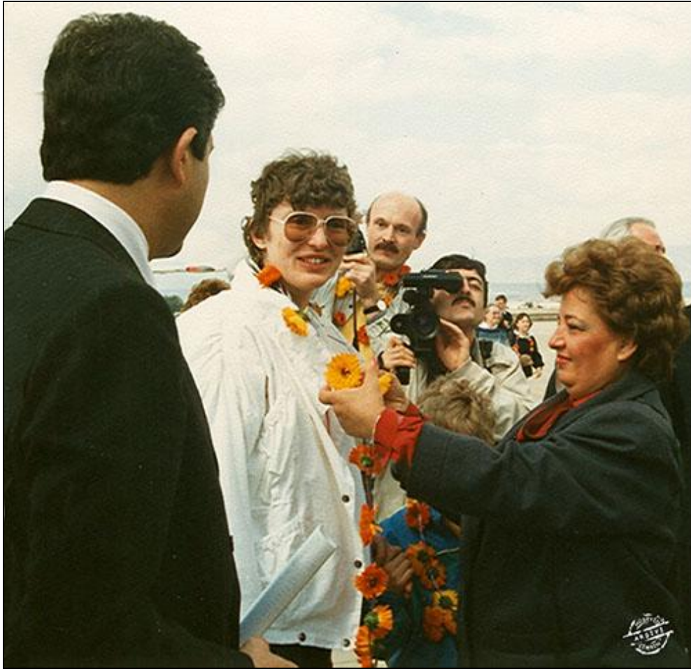
1. kép: Az első turistacsoport köszöntése virágfüzérrel, 1967