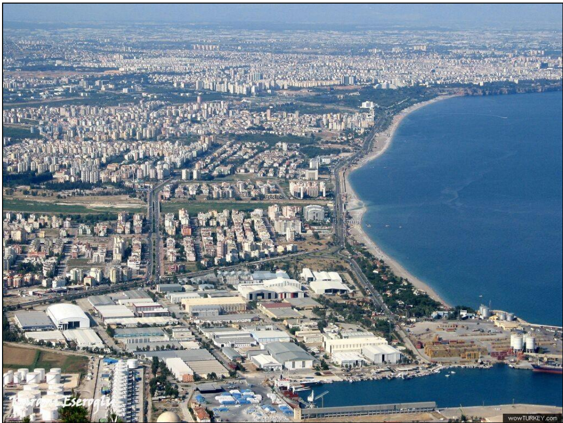
6. kép: Antalya ma