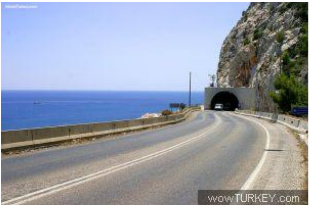
4. kép: A Kemerbe vezető út ma