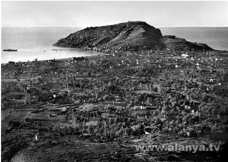
7. kép: Alanya az 1950-es években