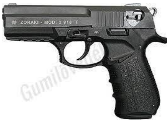
A fegyver, amelyről szó van