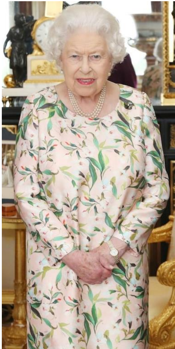
5. fénykép: II. Erzsébet és amerikai államlátogatási bross (2018)

Egy további fénykép, mely szemlélteti az apró részletek hangsúlyosságát 2018-ban, az Egyesült Államok akkori elnökének, Donald Trumpnak, hivatalos látogatása alatt készült. Szembetűnő, hogy II. Erzsébet ugyanazt az öltözetet viseli, mint a megelőző képnél. Jelen esetben nem ilyen értelemben hordoz magában üzenetet, hiszen köztudott, hogy időről időre ismétlésre kerülnek a ruházatok. Viszont mellkéiesen megjegyezném, hogy láthatólag a kalap díszítése különbözik, tehát a botrány igenis nagy hatással volt, így az eredeti koncepció módosítása mellett döntöttek. Ezen a ponton érdemes lenne felvetni azt a kérdést is, hogy nem lett-e volna célszerű az összeállítást úgy meghagyni, mint ahogyan az eredetileg volt, ezzel demonstrálva a virágok állítólagos jelentéktelenségét? Vagy éppen ellenkezőleg, megerősítésként tekinthető a feltételezett politikai egyet nem értésének?