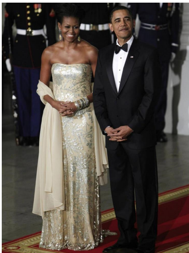
10. fénykép: Michelle és Barack Obama az első állami vacsorán (2009)

A diplomáciai öltözködésnek egyik figyelemre méltó példájaként Michelle Obamát is meg kell említenem. Kimagaslóan dicsérték 2009 és 2017 között, amíg az Egyesült Államok First Lady szerepét töltötte be. Kiemelendő, hogy befutott és feltörekvő amerikai tervezőkkel egyaránt együtt dolgozott, amely segítette felhívni a figyelmet munkájukra. Így tehát ruhatára minden szempontból a férje által vezetett ország reprezentálását szolgálta (Nikas, 2015).