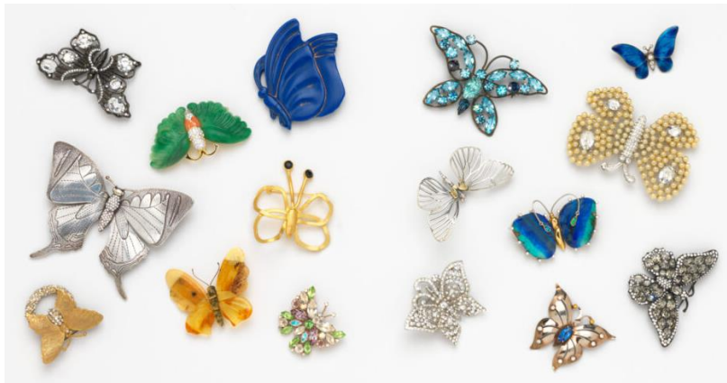
8. fénykép: pillangót ábrázoló brossok

Ami a politikához kapcsolódó érzelmeket illeti, elterjedt a közsférában megjelenő és reprezentáló funkciót betöltő személyekkel szemben azt az elvárást támasztani, hogy a lehető legkevesebb emóció kerüljön kimutatásra. Főleg, mert ezeket könnyű félreérteni, illetve különböző kultúrákban különféleképpen értelmezhetőek. A mellkitűző sikere abban rejlik, hogy egy maximálisan kontrollált formában üzenhessen viselője, így nehezen félreérthető, habár teljesen kizárni sosem lehet ennek lehetőségét. A kedvét előszeretettel hőlégballonokkal és katicabogarakkal is kifejezte, így ezeknek a daraboknak a jelentése mindig nagyon helyzetfüggő volt. A katicabogarak Albright egyik kedvencei voltak és szerencsehozó értelmében funkcionáltak, míg a hőlégballonok a nagy reményeket szimbolizálták (Albright, 2009).