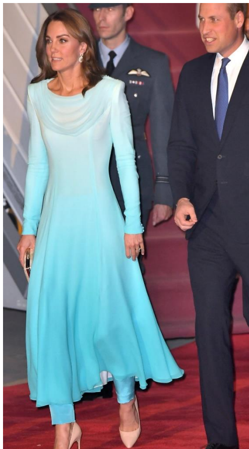
9. fénykép: Katalin hercegné és Vilmos herceg a pakisztáni reptéren (2019)

Ha összehasonlítjuk a jobboldali képpel, egyértelmű a különbség és nagyjátlagban leginkább ez a tipikus megjelenésük. A hercegné valamilyen formában mindig, nem csak épphogy utalásokat tesz, hanem teljes egészében ruhatárát a fogadó ország öltözködési szokásaihoz illeszti. Ellenében férje, már a megszokott öltönyben látható, melynek csupán színe vonzza magára a tekintetet. Az efféle világos krém-fehér szín a közel-kelti kultúrákban szokványos, így ezzel ugyan gesztust tesz a fogadó ország felé, mégis letagadhatatlan a különbség mértéke kettejük között.