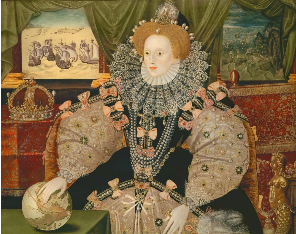
2. festmény: Armada-portré, ismeretlen festő (1588)

Szükségnek tartom egy női példát is hozni a korból, mely „A követek” -hez képest egy női uralkodót mutat be, aki a diplomáciában is fontos szerepet töltött be. Érdekes megvizsgálni, hogy hogyan jelenik meg, öltözete milyen üzenetet közvetít, és ez mennyiben más a már elemzett festményhez képest. Ugyan a műnek háromféle verziója is fennmaradt, de lényegében mindegyik ugyanazt ábrázolja, csak a képkivágásokban és a masnik számában láthatunk különbségeket, így tehát „egynek” kezelem őket elemzésem során (Greenwich, s.a.).