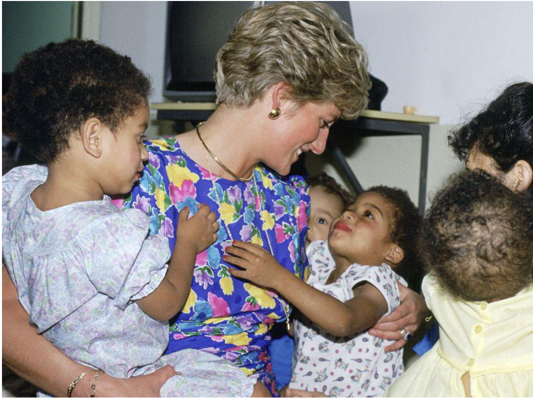
6. fénykép: Diana HIV-pozitív gyerekek körében (1989)

Az egykori walesi hercegnő, Diana Spencer, nem csupán a brit királyi család szabályrendszerét törte meg, az etikett és protokoll többszörös megszegésével, de legfőképpen társadalmi sztereotípiákra is rácafoltt (Morton, 2017). Megjelenésével és viselkedésével elsősorban nem politikai üzenetet közvetített a megelőző elemzésekhez képest, hanem leginkább a világ embereit szólította meg. Így tehát szerintem Diana kitűnő példának ígérkezik, melyen keresztül a téma e perspektíváját szemléltetni lehet, hiszen nem ok nélkül emlegetik őt „a nép hercegnője”-ként (Owen, 2022).