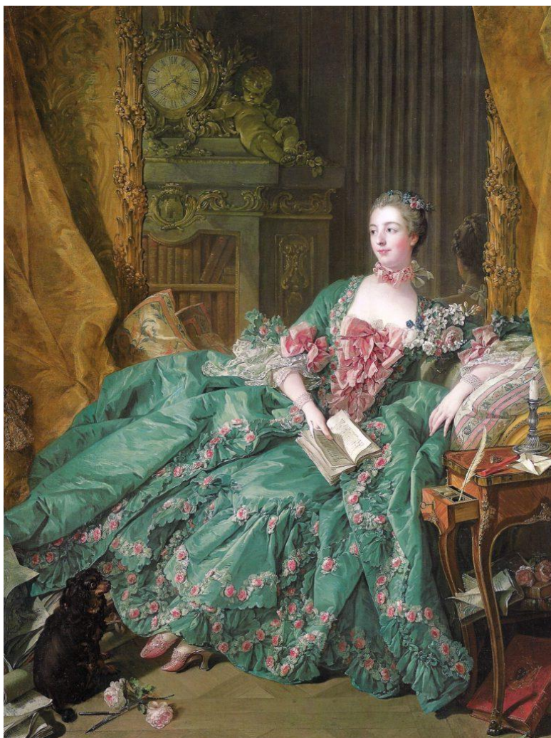
3. festmény: Madame de Pompadour , készítette: François Boucher (1756)