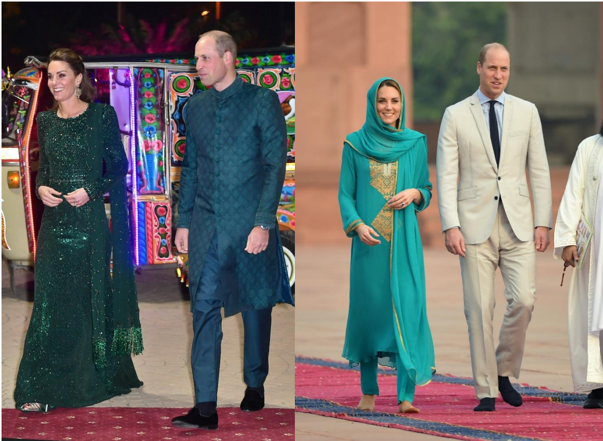
8. fénykép: Katalin hercegné és Vilmos herceg Pakisztánban (2019)

2019-ben Cambridge hercege és hercegnéje öt napos pakisztáni úton vettek részt, melynek keretein belül Katalin öltözéke figyelemreméltó volt. Ezen kívül a szembeállított két fényképpel szemléltetem, hogy mekkora különbség figyelhető meg Katalin és Vilmos öltözéke között.