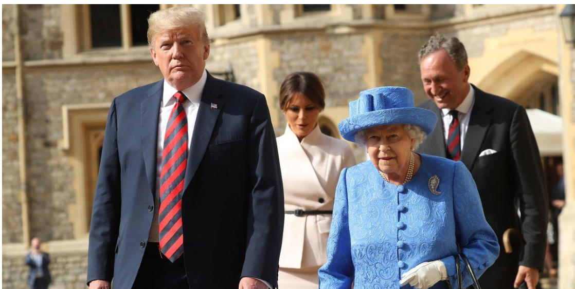
4. fénykép: II. Erzsébet a hírhedt Brexit ruhában módosított kalapdíszszel (2018)

Azonban véleményem szerint abszolút megkérdőjelezhetőek ezek az magyarázatok, hiszen nehéz elképzelni, hogy elkerülhette-e az etikett és protokollért felelős személyek, de leginkább a királynő a figyelmét, az efféle egybeesés. Ezzel együttesen továbbra is minden szemlélő végsősoron magában dönti el, hogy bele akarja-e látni a részletezett üzenetet, vagy sem.