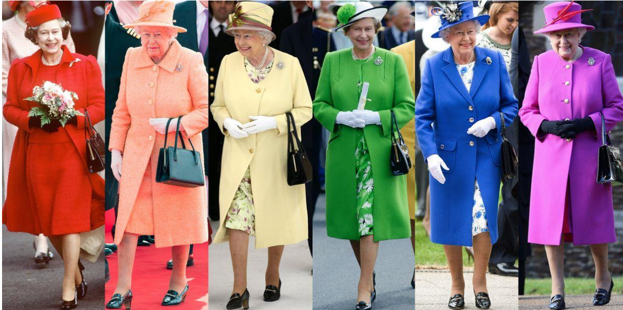
2. fénykép: II. Erzsébet élénk színű ruhákban

Anglia történelmének leghosszabban regnáló királynője ismert volt színes öltözetéről, melynek logikus és igen egyszerű magyarázata van. A közéleti szerepléseikor leggyakrabban élénk színű ruházatban láthattuk, aminek elsődleges célja a kapcsolatteremtés volt az uralkodó és alattvalói között. A brit királyi család esetében jelenlétük mindig is nagy fontossággal bírt, még ha napjainkban egyre több kritika is éri őket. Mégis kutatások szerint egyféle megnyugtató érzést kelt az átlag brit emberben állandóságuk, mely egy megbízható és kiszámítható rendszer, valamint rend látszatát tartja fent (Gardner, 2018). II. Erzsébet nagy közkedveltségnek örvendett, így amikor nyilvános fellépései voltak, a feltűnő színválasztása által megkönnyítette a tolongó közönség dolgát azzal, hogy egyszerűbben beazonosítható volt akár nagy távolságokból is. Ilyen módon volt lehetőség kapcsolat teremtést, bizalmi viszonyt és egyféle közelséget éreztetni, mely nagymértékben alátámasztotta a királynő legitimációját (Abraham, 2018).