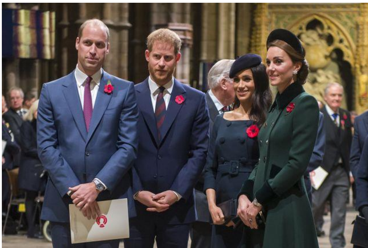
1. fénykép: Brit királyi család és piros pipacsos kitűző, Harper's Bazaar (2019)

Feltételezhetnénk, hogy mára már az öltözet majdhogynem teljesen elvesztette jelentőségét, mivel egyféle egyenruha alakult ki a férfi politikusok között, ugyanaz a sötét színű öltöny, általában fehér ing és az egyetlen eltérő színű ruhadarab a nyakkendő szokott lenni. Csak ritka alkalmakkor láthatunk egyéb öltözetet, mint például a katonai egyenruhát, melyet a brit királyi család férfi tagjai szoktak viselni bizonyos eseményeken. Szimbolikus kiegészítőket, mint kitűzőket vagy ékszereket, pedig még annál is ritkábban, és akkor szintén csak azért, mert az olykor elvárt.