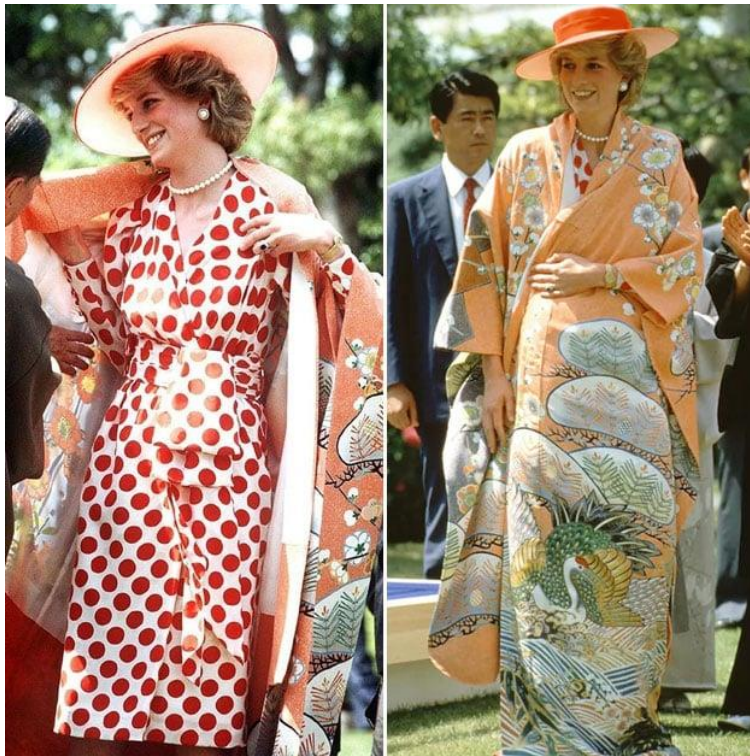
7. fénykép: Diana piros pöttyös ruhában Japánban (1986)

Egy további kiegészítő is hiányzik, ugyanis általában az efféle formális látogatásakor az előírások szerint a kalapviselés is az öltözet kötelező részét képezné. Azonban Diana megfigyelte, hogy a túlzottan hivatalos külső egy bizonyos távolságtartást eredményez, így tehát igyekezett vidám, kevésbé formális és hétköznapibb ruhákat választani, főleg, amikor gyerekeket látogatott (Goldstone, 2020)