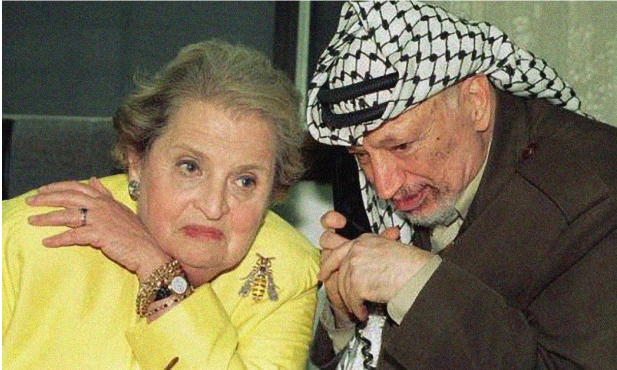
12. fénykép: darazsat ábrázoló bross

A képen Albright mellett Jassir Arafatot láthatjuk, amint Bill Clintonnal telefonon már hosszú órák óta tárgyaltak. Közösen a közel-keleti palesztin konfliktusra kerestek megoldást. A darázssal díszített kitűző által a tárgyalásokkal kapcsolatos megelőző álláspontját és ezzel együttesen az Egyesült Államokét is kívánta kifejezni, így tehát egyféle békés megközelítést és kompromisszumkészséget sugallt. Azonban egyidejűleg azt is érezteti tárgyalófeleivel, hogyha ingerküszöbe átlépésre kerül, akkor komoly következményekkel kell számolni, mely a darázscsípésnek értelmezése.