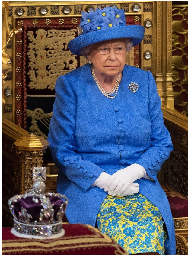
3. fénykép: II. Erzsébet Brexit kalapban (2017)

jelentőséggel voltak vagy akár indirekt módon tartalmasabb üzenetet kívántak közvetíteni. Minden bizonyossággal kijelenthető, hogy az elemzendő példákban látható összeállítások még véletlenül sem válogatás nélkül és megfontolatlanul történtek.