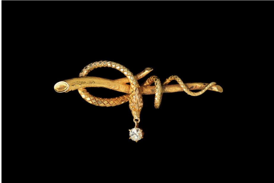
11. fénykép: kígyóval díszített brosz

Az eset előzményei közé tartozott, hogy Madeleine Albright, mint az Egyesült Államok ENSZ-nagykövete erős kritikát gyakorolt Szaddám Husszein irányába. Irak nem teljesítette kötelezettségét, ami a teljeskörű tájékoztatást a nukleáris, vegyi, valamint biológiai fegyverekkel kapcsolatos tervekkel illette. Reakcióképpen erre megjelenítettek egy verset, melyben Albrightot kígyóhoz hasonlították. Nem sokkal később hivatalos megbeszélésre készült iraki tisztviselőkkel, amikor véletlenül jutott eszébe, hogy jó néhány évvel azelőtt, lényegében céltalanul, vásárolt egy kígyót ábrázoló melltűt, melyet még sosem tűzött ki. Számára nyilvánvaló volt az összefüggés, de nem feltételezte, hogy az apró kiegészítő ilyen egyértelműen közvetítené üzenetét, azonban a média egyből felfigyelt a részletre, így hamar híre ment a szokatlan kommunikációs eszköznek, mely egyféle siker garanciájaképpen is értelmezhető (Albright, 2009).