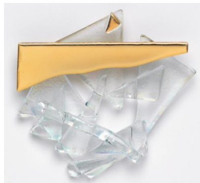
15. és 16. fénykép: Madeleine Albright kék ruhában és az összetört üvegplafon mellett (2016)

Madeleine Albright, mint az Egyesült Államok első női külügyminisztere áttörte az üvegplafont, így ezt egy kitűző formájában is elkészíttette. Metaforikusan a láthatatlan akadályokat és társadalmi normákat jelképezi, melyek különösen a nőket akadályozzák meg a vezetői pozíció elérésben. A széttört üveg a korlátok áttörését és a nemek közötti egyenlőség támogatását szimbolizálja. 2016-ban, amikor a Demokrata Párt Nemzeti Kongresszusán hivatalosan bejelentették Hillary Clinton elnökjelölését, Albright szolidaritásból ezt a melltűt viselte és a párt tipikusan kék színébe öltözött. Történelmi pillanat volt, hogy az Egyesült Államok egyik jelentős pártja egy nőt válasszon, mint elnökjelöltjüket, így tehát egy újabb előrehaladás történt, amivel egy további üvegplafon tört össze.