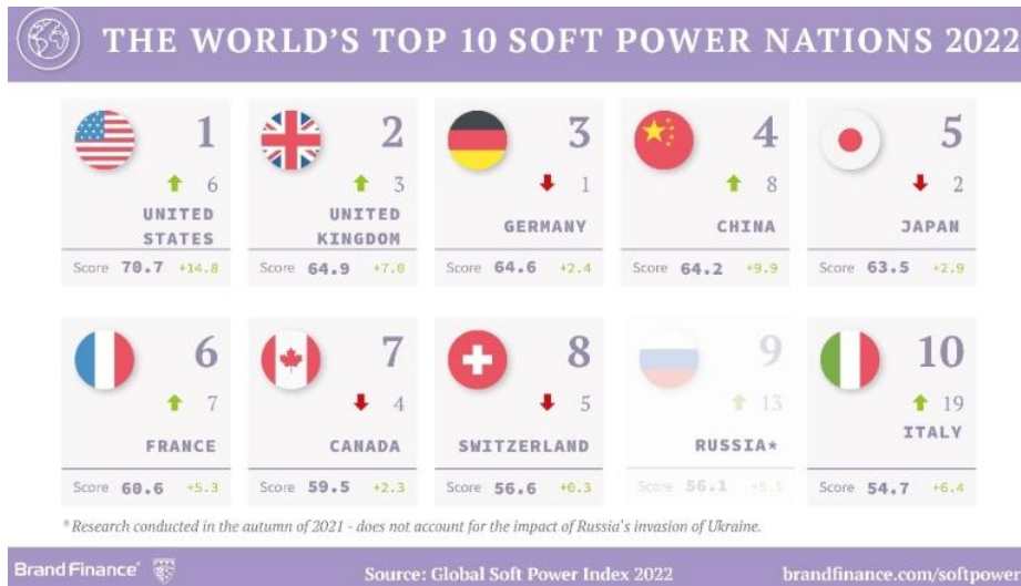
4. ábra A világ első 10 Soft Power hatalma a 2022-es rangsorolás alapján (rangsorolás mértékegysége: pontszám)