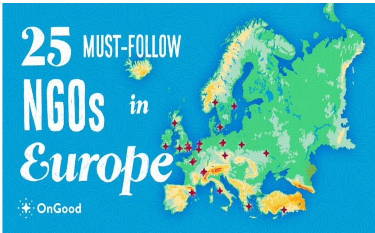
1. ábra NGO-k Európában