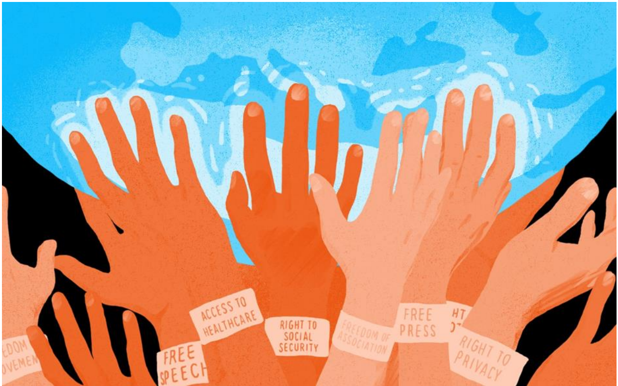
3. ábra Civil szervezetek ábrázolása